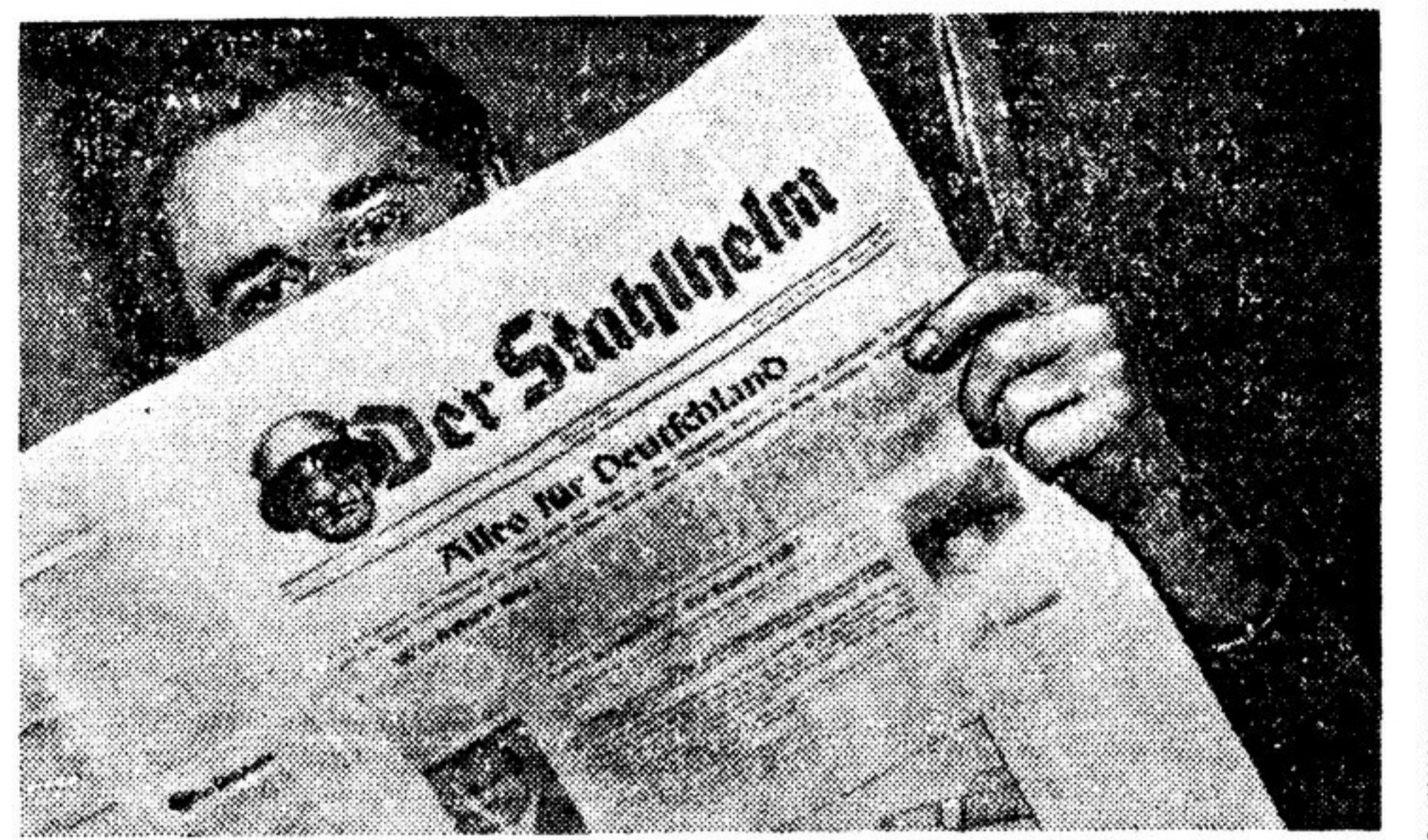
С вedom и благословения оккупационных властей трех западных держав в «сонной республике» возрождаются милитаристские и фашистские организации. В феврале 1951 года издаваемая в Западной Германии газета «Нейе цейтунг» сообщила о негласном восстановлении известной фашистской организации «Стальной шлем». За время, прошедшее с тех пор, ремилитаризация Западной Германии, которую осуществляют американские империалисты, стала проводиться еще более ускоренными темпами. И «Стальной шлем» был окончательно легализован. Начиная с октября минувшего года снова выходит печатный орган «Стального шлема».

На фото: один из номеров этой газеты. Первая страница прествит злободневными: «Все для Германии!», «Товарищи по оружию, время зовет!... Зловещее объединение германских реваншистов вновь действует...»