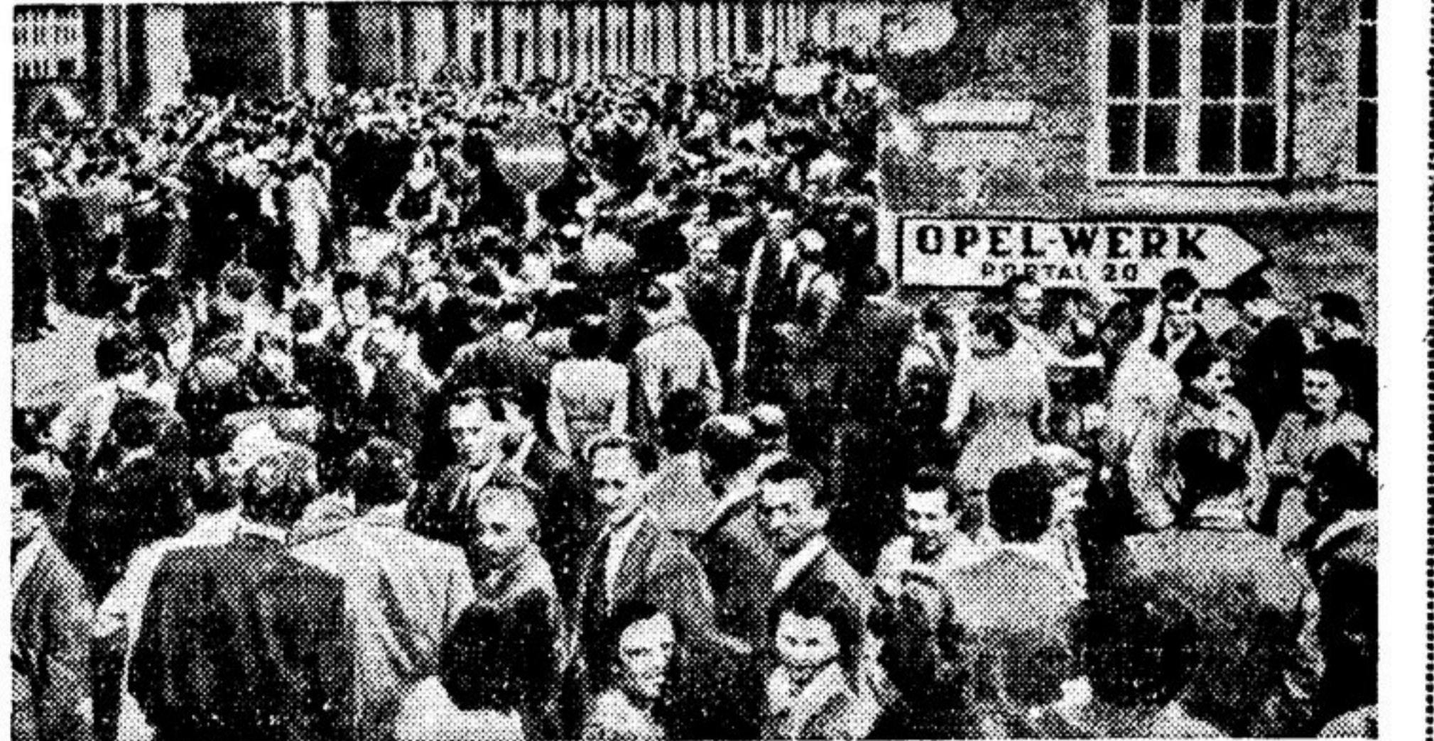
Около месяца продолжалась забастовка двадцати тысяч рабочих завода «Опель-верке», находившегося в западногерманском городе Росельсгейме и принадлежавшего американскому концерну «Дженерал моторс». Трудящиеся требовали повышения заработной платы ввиду роста инфляции, вызванной огромными расходами на ремилитаризацию Западной Германии.

Бонские правители, пытаясь заставить рабочих прекратить борьбу, использовали все средства провокации и полицейского террора вплоть до применения бомб со слезоточивым газом. Однако бастующие мужественно продолжали отстаивать свои требования. И только из-за подлого предательства реакционного руководства профсоюзов Западной Германии забастовка в конце концов была сорвана.